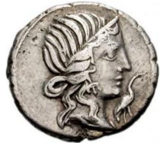
Quintus Caecilius Metellus Pius. (Roma, 130 a. C. - 64 a. C.) Anverso de denario: cabeza de Pietas , delante: cigüeña.